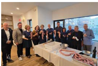
1. Proglašenje vitezova u New Yorku, 2. Gostovanje u TV emisiji „Iz srca Europe” 3. Predstavljanje istarskih suhomesnatih proizvoda i vina, 4. Izrada istarske kobasice u New Yorku